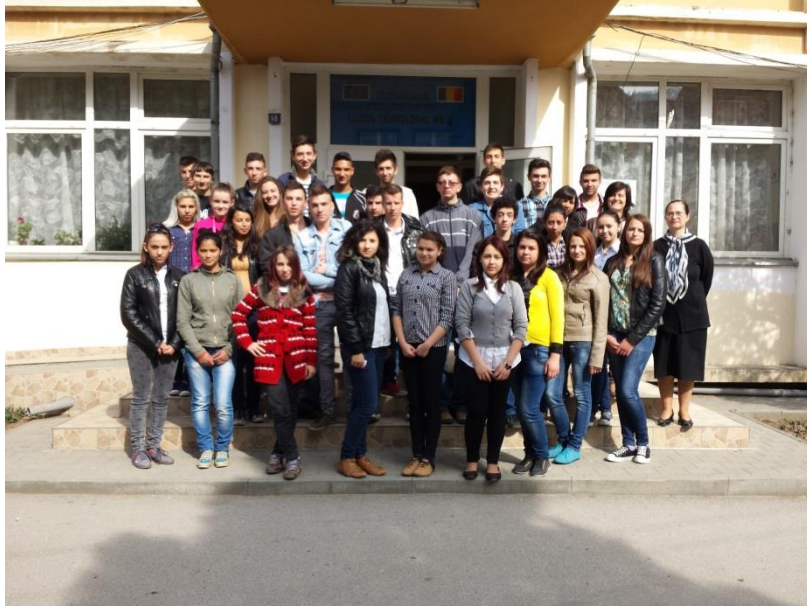
Politia Municipiului Sighisoara