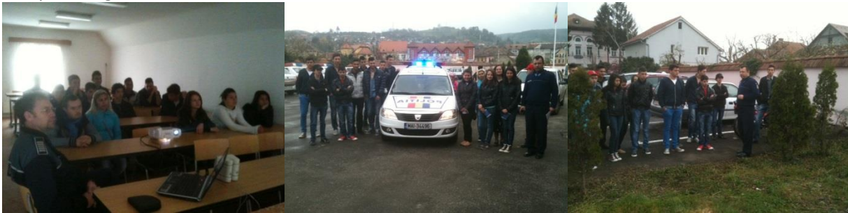
Centrul de zi